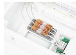
Cableado de elemento de iluminación fijo, multipolar