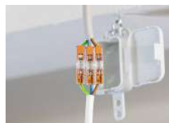
Conexión de dispositivos de iluminación en falsos techos