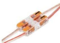
Ampliación sencilla de líneas